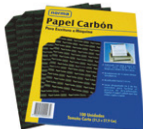
Papel carbón, cinta máquina de escribir, esfero, tinta,labial ALCOHOL ETÍLICO