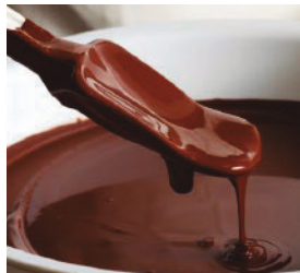
Chocolate, café, té, grasa, aceite, betún, marcas suela de zapato, azfalto. LIMPIADOR NEUTRO- PAÑO VERDE Mancha de cigarrillo PAÑO ROJO O BLANCO