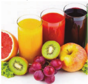
Frutas, jugos, leche, crema, bebidas, vinos, cerveza: LIMPIADOR NEUTRO