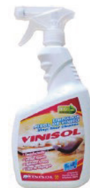
Orines, vómito, excremento LIMPIADOR NEUTRO